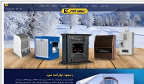
گروه صنعتی مشهد دوام www.mashhaddavam.com