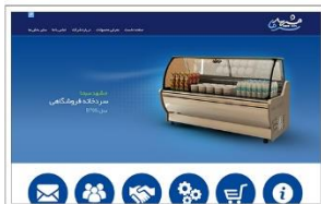
کارخانه مشهد سرما www.mashhadsarma.ir