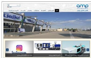
اتلس ماشین پلیمر www.atlasmachinepolymer.com