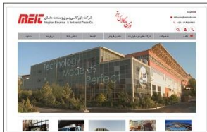
شرکت بازرگانی برق و صنعت مغان www.moghantrade.com