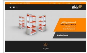
شرکت رادان صنعت شرق www.radan-ir.com