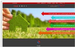
گروه تولیدی شفیخ سازه www.3s-pars.com