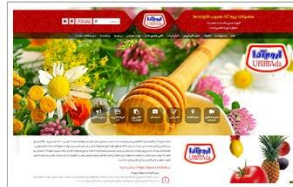
محصولات غذایی اروم آدا www.urumada.com