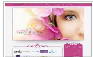
شرکت Vip Prestige www.vipprestige.ir

با تجربه طراحی و پیاده سازی بیش از ۹۵۰ وب سایت