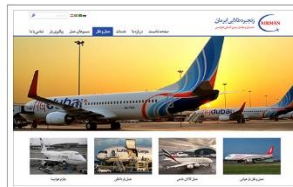
شرکت حمل و نقل هوایی زنجیره طلایی ایران www.agc-air.com