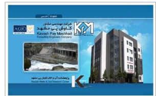
شرکت مهندسی مشاور کاوش پی مشهد www.kavosh-pay.com