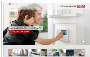
فناوری های راهبردی آریاز www.ariaz.ir