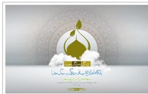
وب سایت حجت الاسلام والمسلمین ماندگاری www.berangekhoda.ir