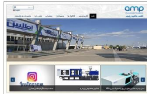
اطلس ماشین پلیمر www.atlasmachinepolymer.com