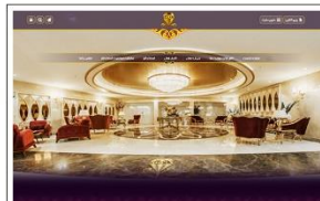
هتل الماس نوین www.almasnovin.com