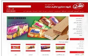
گروه صنایع غذایی مکت www.maxxfoodco.com