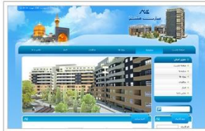
شرکت عمارت هشتم شرق www.emarathashtom.ir