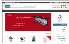
فروشگاه اینترنتی مدیا سنتر www.mc24.ir