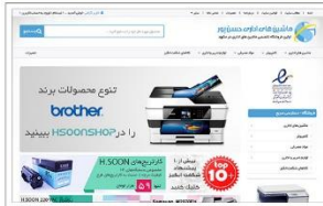
فروشگاه ماشین های اداری حسن پور www.hsoonshop.com