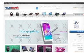
فروشگاه ایسوس سنتر نمایندگی محصولات ایسوس www.asuscenter.ir