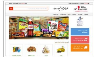
فروشگاه اینترنتی هیلا مارکت hilamarket.com