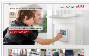
فناوری های راهبردی آریاز www.ariaz.ir