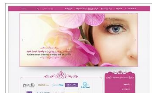
شرکت Vip Prestige www.vipprestige.ir

با تجربه طراحی و پیاده سازی بیش از ۹۵۰ وب سایت