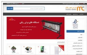
فروشگاه اینترنتی مدیا سنتر www.mc24.ir