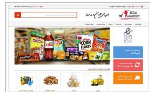
فروشگاه اینترنتی هیلا مارکت hilamarket.com