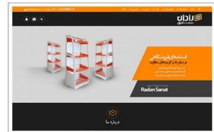
شرکت رادان صنعت شرق www.radan-ir.com