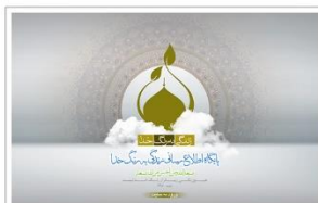
وب سایت حجت الاسلام والمسلمین ماندگاری www.berangekhoda.ir