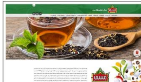
کارخانه محصولات غذایی مسما www.mosama.ir