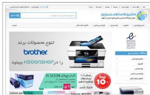
فروشگاه ماشین های اداری حسن پور www.hsoonshop.com