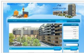
شرکت عمارت هشتم شرق www.emarathashtom.ir