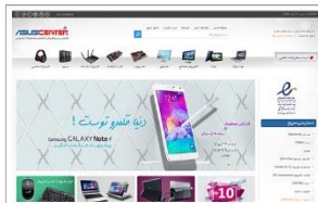
فروشگاه ایسوس سنتر نمایندگی محصولات ایسوس www.asuscenter.ir