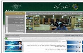
دانشگاه پیام نور مشهد www.pnum.ac.ir