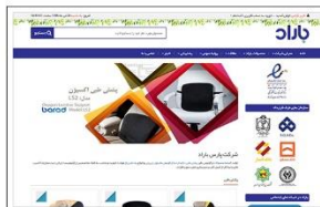
شرکت پارس باراد www.barad.com