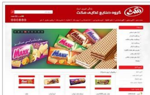
گروه صنایع غذایی مکت www.maxxfoodco.com