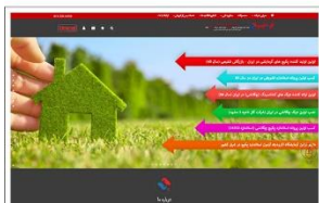
گروه تولیدی شفیخ سازه www.3s-pars.com