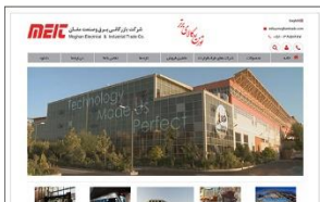
شرکت بازرگانی برق و صنعت مغان www.moghantrade.com