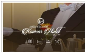
هتل کوثر www.kowsarhotel.co