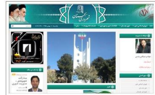
شهرداری بجنستان www.bajestan.ir