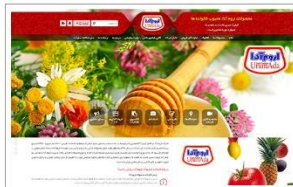
محصولات غذایی اروم آدا www.urumada.com