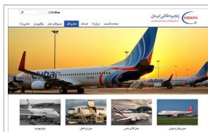
شرکت حمل و نقل هوایی زنجیره طلایی ایران www.agc-air.com