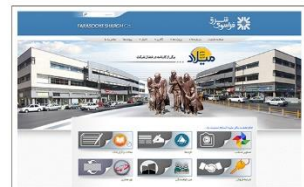
شرکت فراسوی شرق www.farasooyeshargh.com