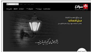
صنایع روشنایی سوتارا www.sootara.ir