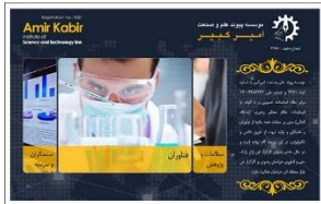
موسسه پیوند علم و صنعت امیرکبیر www.lsta.ir