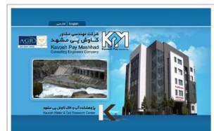
شرکت مهندسی مشاور کاوش پی مشهد www.kavosh-pay.com