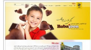
محصولات غذایی شهر بابانا www.shahrbabana.com