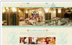
هتل مدینه الرضا www.madinahalreza.com