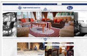
شرکت فرش نگین مشهد www.negincarpet.com